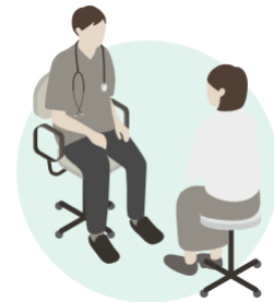
Image licenses: Examination Woman icon by DBCLS https://togotv.dbcls.jp/en/pics.html is licensed under CC-BY 4.0 Unported https://creativecommons.org/licenses/by/4.0/

Le choix du traitement repose toujours sur un dialogue entre vous et votre médecin, qui prendra le temps de vous expliquer les différentes options et d'écouter vos besoins et vos préoccupations.